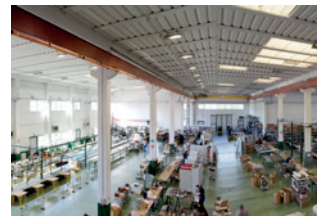
Stabilimento produttivo ELE.MAC

Fondata nel 1992, Elemac Srl opera nel proprio stabilimento di Barberino Val d'Elsa (FI) su una superficie di 6000 mq. con circa 70 addetti, specializzata nell'automazione di macchine e di impianti automatici di ogni genere, dal settore edile, alimentare, conciario, tessile, siderurgico, medicale alle lavorazioni del legno e della carta, comprese le attività di confezionamento e immagazzinaggio. Importanti esperienze nello sviluppo di soluzioni uniche per i propri clienti ne hanno permesso l'affermazione nell'intero territorio nazionale. La Ele.Mac ha l'attenzione rivolta in primis alle esigenze del cliente e si attiva per fornire soluzioni integrate e